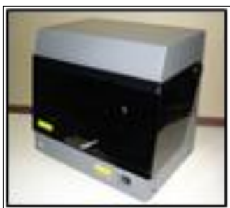
窩洞、支台歯形成評価装置の概要